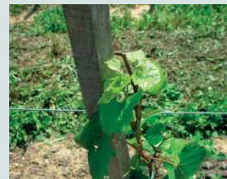
Škoda na trti in sadnem drevju od srnjadi.