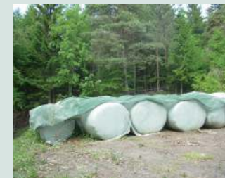
Varovanje silažnih bal.