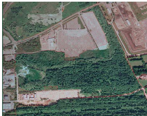
*rdeče označeno so nelovne površine

Nelovne površine, kot jih določa ZDLov-1 (10. člen) so: