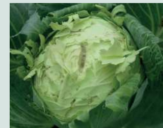
Škoda na zelju od sive vrane.