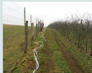
Varovanje intenzivnega nasada in poljščin.