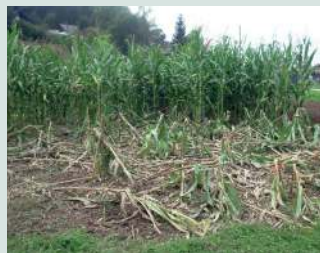
Škoda na koruzi in travniku po obisku divjega prašiča.